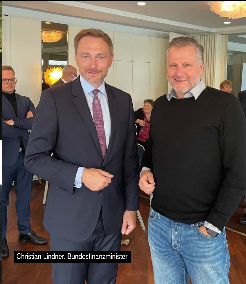
Christian Lindner, Bundesfinanzminister