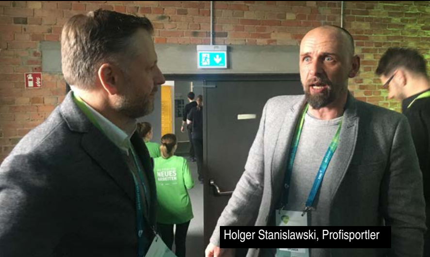
Holger Stanislawski, Profisportler