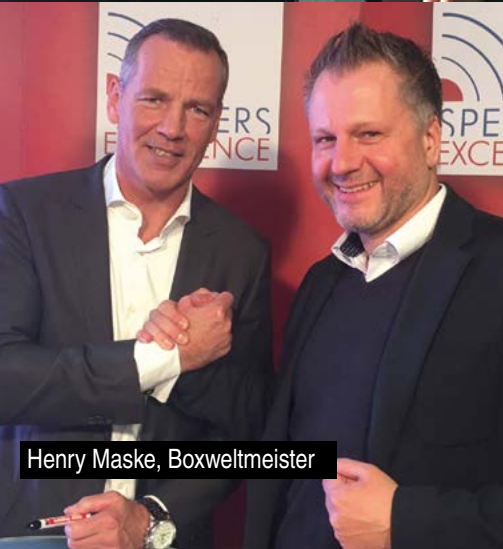
Henry Maske, Boxweltmeister