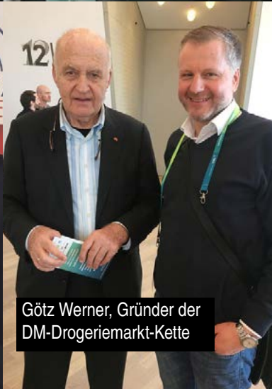
Götz Werner, Gründer der DM-Drogeriemarkt-Kette