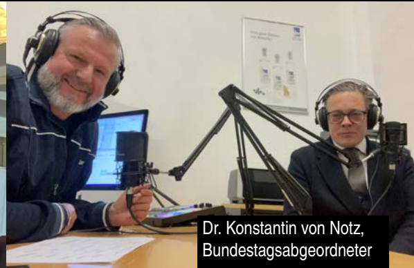
Dr. Konstantin von Notz, Bundestagsabgeordneter